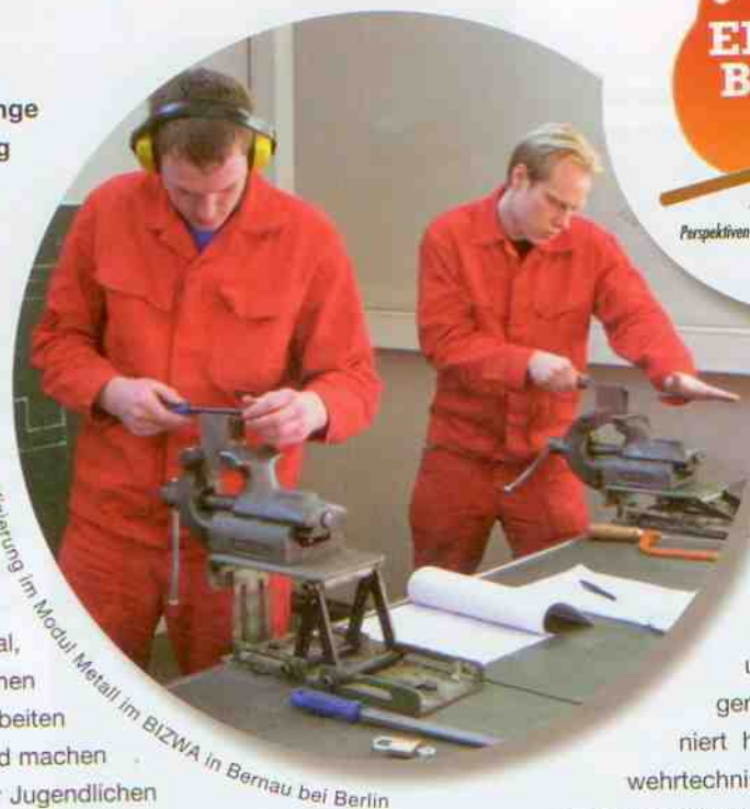
Qualifizierung im Modul Metall im BIZWA in Bernau bei Berlin

Das Projekt verfolgt einen für Berlin innovativen Ansatz, den zuvor bereits die Feuerwehr Düsseldorf erfolgreich realisiert hat. Ein spezifischer, in Zusammenarbeit mit der Handwerkskammer Berlin